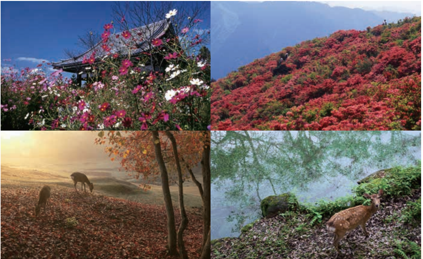
【表紙写真・患者様撮影】