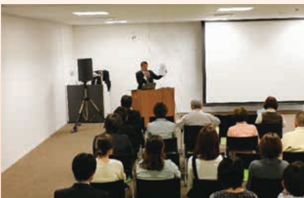
<無料低額診療について>