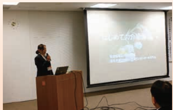
<介護保険について>